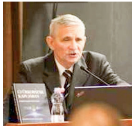
Bizottság, a Zrínyi Kiadó és a Ludovika Egyetemi Kiadó, a doktori iskolák éven-

„Mit tehetünk annak érdekében, hogy minél szélesebb körben megismerjék és elfogadják a hadtudomány jelenlétét?” — tette fel a kérdést a nyugalmazott vezérőrnagy. A hadtudomány megis-