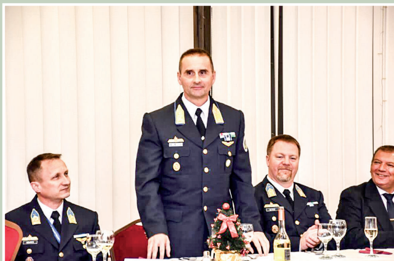
35 év a repülés szolgálatában 10. oldal