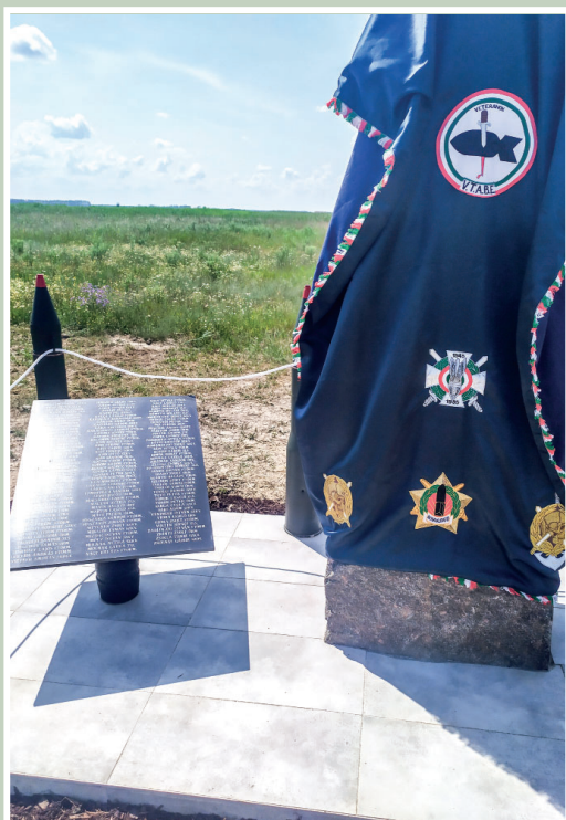
Mementó a Hortobágyon... 28. oldal