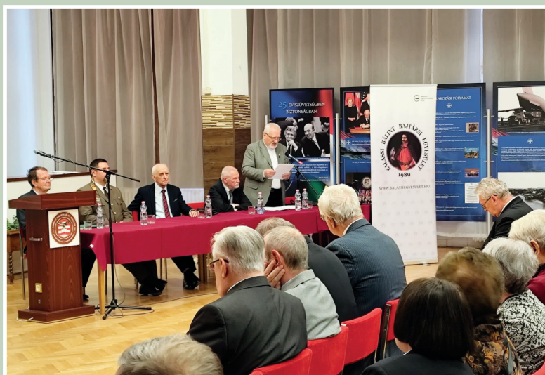
35 éves a Balassi Egyesület 4. oldal