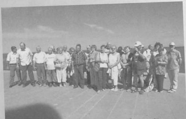
BAjtársak a Szlovén tengerparton